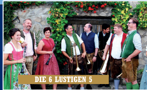
DIE 6 LUSTIGEN 5